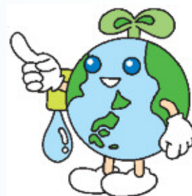
企業団すいどうキャラクター 「アースイ」

この水質検査をどのように行うかを、お客さまに広く知っていただくため、検査する場所や項目、頻度などについて記したものが水質検査計画です。