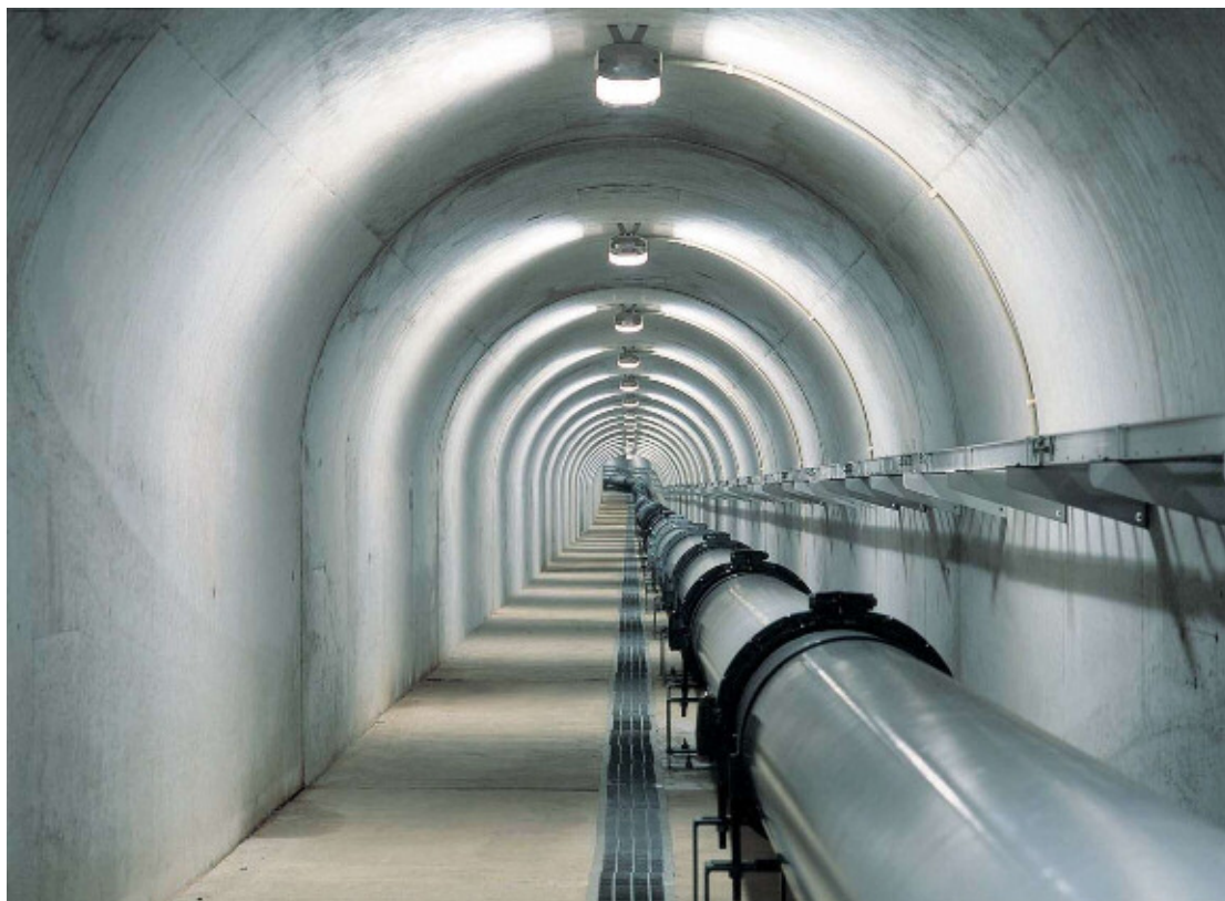
立野水源（ずい道）延長 790m